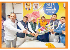
लेकर 24 दिसंबर तक आम आदमी पार्टी के कार्यकर्ता बदलाव का संदेश देंगे। उन्होंने कहा कि इस यात्रा के दौरान हरियाणा के बहाल स्थिति और दिल्ली और पंजाब में आम आदमी पार्टी द्वारा किए गए क्रांतिकारी बदलावों के बारे में प्रदेश की जनता को जागरूक किया जाएगा। यात्रा का उद्घाटन गांवों में किया जाएगा।

आम आदमी पार्टी के प्रदेश अध्यक्ष और राज्यसभा सांसद डॉ. सुशील गुप्ता ने बुधवार को फरीदाबाद में आम आदमी पार्टी के कार्यकर्ताओं और पदाधिकारियों के साथ बैठक कर प्रदेशस्तरीय बदलाव यात्रा की तैयारियों का जायजा लिया और रूपरेखा तैयार की। डॉ. सुशील गुप्ता ने बताया कि आम आदमी पार्टी पूरे प्रदेश में बदलाव यात्रा निकालेगी। हद हरियाणा के लाल ने, एक मौका केजरीवाल ने के नारे के साथ प्रदेश की 90 विधानसभाओं में बदलाव यात्रा निकाली जाएगी। 15 दिसंबर से