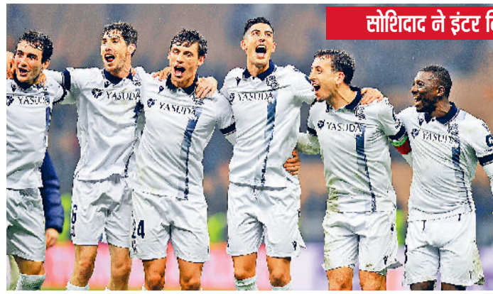
सोशिदाद ने इंटर मिलान के साथ गोलरहित ड्रा खेला

युनाइटेड ने यूरोपा लीग में स्थान भी पक्का नहीं किया। इस ग्रुप से कोपेनहेगन भी अंतिम 16 में पहुंच गई जिसने गालाटासारे को 1-0 से हराया। इस नतीजे के मायने हैं कि अगर युनाइटेड जीत भी जाती तो अगले दौर में नहीं पहुंच पाती। पूर्व मैनेजर एलेक्स फर्ग्युसन के 2013 में रिटायर होने के बाद से सात प्रयासों में तीसरी बार युनाइटेड नॉकआउट में नहीं पहुंच सकी है और दूसरी बार चैंपियंस लीग ग्रुप में सबसे नीचे रही है।