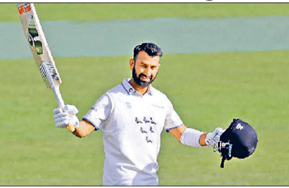
एजेसी ►► होव

फाइनल तक रोहित के लिए कप का सफर शानदार रहा, लेकिन 19 नवंबर को फाइनल में आस्ट्रेलिया ने भारत को हराया। फाइनल की हार के बाद रोहित मैदान से निकले तो उनकी आंखें भरी हुई थीं। वह इस दर्द को भुलाने के लिए ब्रेक पर इंग्लैंड चले गए थे। रोहित ने इंस्टाग्राम पर अपने फैन पेज पर लिखा, ‘पहले कुछ दिन तो मुझे समझ ही नहीं आया कि इससे कैसे उबरूंगा। मेरे परिवार और दोस्तों ने मेरा हासला बनाए रखा। हार को पचना आसान नहीं था, लेकिन जिंदगी चलती रहती है और आगे बढ़ना आसान नहीं था। लोग मेरे पास आकर कहते थे कि उन्हें टीम पर गर्व है।’