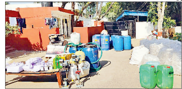
रेवाड़ी। पुलिस की ओर से पकड़ा गया नकली सामान बनाने का सामान।

पकड़े गए आरोपियों में दो शराब ठेकेदार भी शामिल