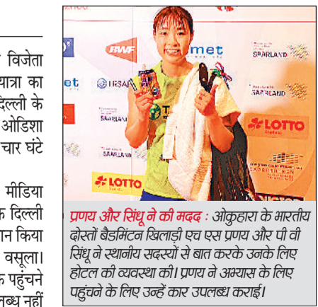
प्रणय और सिंधु ने की मदद : ओकुहारा के भारतीय दोस्तों बैडमिंटन खिलाड़ी एच एस प्रणय और पी वी सिंधु ने स्थानीय सदस्यों से बात करके उनके लिए होटल की व्यवस्था की। प्रणय ने अग्रिम के लिए पहुंचने के लिए उन्हें कार उपलब्ध कराई।

पूर्व विश्व चैंपियन और ओलंपिक पदक विजेता नोजोमी ओकुहारा ने हाल ही में भारत यात्रा का अपना खराब अनुभव साझा किया जहां दिल्ली के एक कैब ड्राइवर ने उन्हें चुना लगाया और ओडिशा के कटक में होटल में उन्हें कमरे के लिए चार घंटे तक इंतजार करना पड़ा।