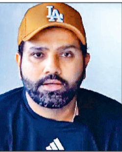
एजेसी ►► नई दिल्ली

रोहित शर्मा ने वनडे वर्ल्ड कप में मिली हार पर पहली बार खुलकर बात की। वनडे वर्ल्ड कप में हार के बाद रोहित शर्मा को पता नहीं था कि उस हार की निराशा से वह कभी उबर सकेंगे या नहीं, लेकिन अब फैनस के प्यार ने उन्हें एक बार फिर टॉप पर पहुंचने का प्रयास करने के लिए प्रेरित किया है। रोहित ने यह नहीं बताया कि वह किस टॉप की बात कर रहे हैं, लेकिन समझा जाता है कि वह अगले साल अमेरिका और वेस्टइंडीज में होने वाले टी20 विश्व कप में भारत की कप्तानी के बारे में सोच रहे हैं।