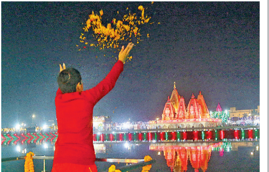
कुरुक्षेत्र। गीता जयंती समारोह के उपलक्ष्य में सजे ब्रह्मसरोवर तट का विहंगम दृश्य।