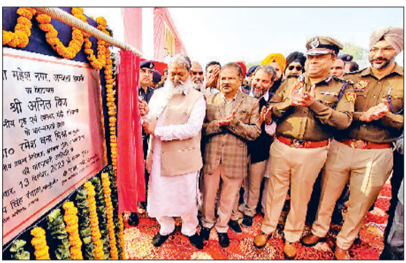
चंडीगढ़। अम्बाला छावनी में 4.62 करोड़ रुपये की लागत से बनने वाले महेशनगर थाने के नए भवन का शिलान्यास करते हुए गृह मंत्री अनिल विज।

हरियाणा के गृह एवं स्वास्थ्य मंत्री अनिल विज ने कहा कि हरियाणा पुलिस को मॉडर्न पुलिस बनाना चाहते हैं और इस दिशा में लगातार कार्य किए जा रहे हैं। कार्यस्थल पर उन्हें बेहतर माहौल उपलब्ध कराने के लिए अब हरियाणा में जितने भी नए पुलिस भवन बनेंगे उनमें स्टाफ के लिए जिम का प्रावधान तथा सेंट्रल एयर कूल सिस्टम होगा। विज बुधवार को अम्बाला छावनी में 4.62 करोड़ रुपये की लागत से महेशनगर थाने के नए भवन का शिलान्यास रखने के उपरांत उपस्थित जनसमूह को संबोधित कर रहे थे।