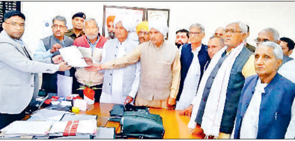
जींद। डीसी को ज्ञापन सौंपते हुए खाप चौधरी।