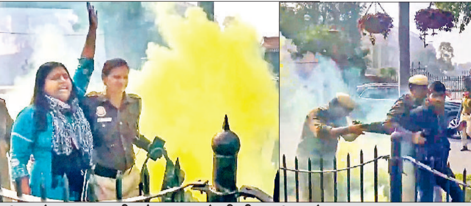
संसद के बाहर युवती और युवक ने भी पीला धुंआ छोड़ जमकर काटा बवाल।